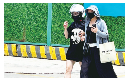
烈日下市民注意防晒