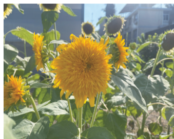
“泰迪”的花朵像菊花

而今年,福州市民更是有眼福。据悉,闽江公园管理处将与福建省农科院合作,在原有金色向日葵的基础上,增种奶白色向日葵、重瓣泰迪向日葵与彩色向日葵,给市民带来不一样的视觉体验。