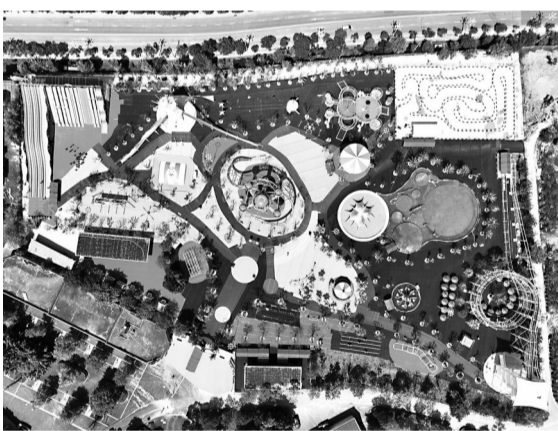
乐园航拍图

据悉,该主题乐园是由福州城投集团所属市城投园林集团招商、运营并重点打造的文旅项目,全园占地面积约35亩,是全国首个获得动画片《海底小纵队》官方授权的高品牌性IP无动力亲子乐园。该乐园以官方授权动画片中相关的角色、场景、故事为核心主题元素,实景还原动画中经典场景,精心打造了旋转木马、自控飞机等小型