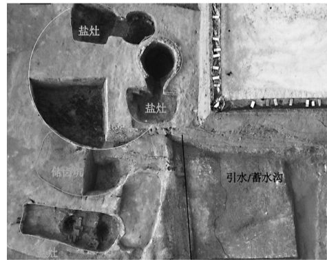
后北团遗址制盐相关遗迹

“沙井头等不同时期盐业遗址的考古发现,进一步明晰了我国江淮东部盐业生产历史发展脉络,对研究西汉以来中央政府对沿海地区盐业的管理,以及不同时期制盐工艺的技术传承发展具有重要价值。”相关专家说。