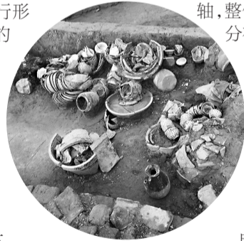
淮安板闸镇遗址内的一处饭店后厨

“庆成门、新路、板闸镇三处遗址再现了明清时期大运河沿线的繁荣景象,反映了大运河沿线市镇发展、人地关系演变与河道治理与变迁,是研究运河漕运、盐运和关榷收等问题的重要实物资料。”专家认为。