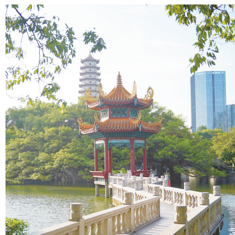
傍晚的西禅寺美如画