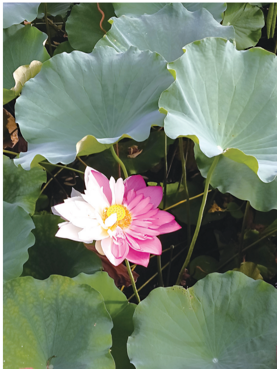
被采摘的双色荷花

据福建农林大学花卉专家表示,被采摘的双色荷花品种为太空莲,是一种以太空育种的方式培育的莲花,它具有生育期长、抗性强、花多、莲蓬大、结实率高、颗粒大、品质优等特点。2012年,学校将包括太空莲在内的共7个品种荷