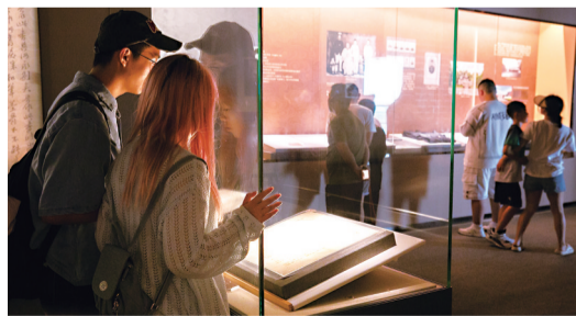
观众在观看林觉民《与妻书》真迹

看过黄昇墓的众多华美丝织品,发掘于福州北郊浮村的墓葬本身是怎样的?怎样形态的德化窑炉烧出了如凝脂之玉的“中国白”?一