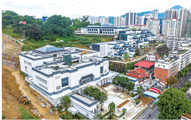
凤山书院

封顶!完工!……除了安溪县,近日,泉州又一批项目传来新进展,涉及工业、教育、医疗、产业园等多个领域,分布于鲤城区、台商投资区、丰泽区、晋江市等区域。就此,连日来记者前往相关项目探访。