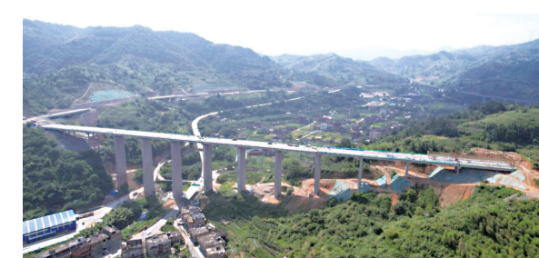
剑斗东阳大桥及连接线全线梁片架设完成

安溪县发改局相关负责人介绍,今年以来,安溪县继续深化项目引领,通过探索建设全生命周期服务平台,实现项目谋划、前期、建设、竣工、投