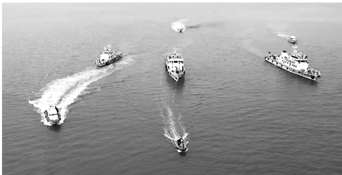
执法船只编队巡航

海都讯(记者 马俊杰) 记者从福建省海洋与渔业执法总队获悉,自2024年1月9日起,我省开展以严查涉渔“三无”船舶、严管涉渔乡镇船舶和在册登记渔船为主要内容的“一查两严管”专项执法行动,整治海上违法捕捞等各类涉渔违法违规行为。