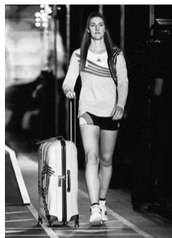
闽企生产比利时队比赛服

另一家闽企匹克,早在2018年7月就与比利时奥委会签约成为战略合作伙伴。比利时奥委会时任副主席塞弗对媒体强调:匹克是中国体育品牌的标杆,和匹克体育强强联手,将有助于比利时在奥运会上取得更好成绩。由匹克负责生产制造的比利时代表团比赛服,在巴黎奥运会开始前成为全球观众心目中的“大赢家”之一。这套比赛服被命名为“时尚漫步向巴黎”,