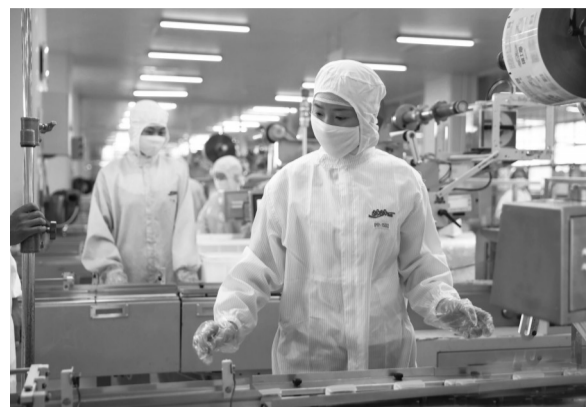
中国队奥运食品已陆续交付