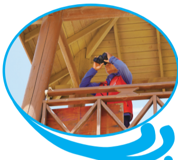
队员在瞭望台上紧盯着海面上的情况

在阳光灿烂的日子里,海面上的反光如同镜面一般,这不仅会影响队员们的视线,长时间盯着海面还可能让他们的眼睛感到不适。