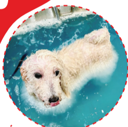
宠物店内的宠物犬正在享受SPA