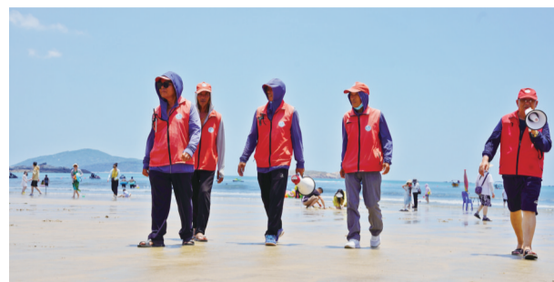
龙王头景区海上救护队

海都讯(记者 梁展豪 林涓 实习生 朱鸿雨 文图)在福建东南沿海的平潭综合实验区,有一片美丽的海滩——龙王头沙滩,这里沙质细腻,海水清澈,是游客们喜爱的海滨度假胜地。而这片海滩的背后,有一群人在默默守护着景区游客的安全,他们就是景区海上救护队。