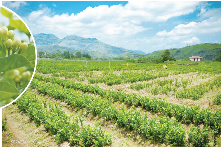
位于闽侯苏洋的茉莉花田