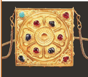
明代“链条包”镶嵌着宝石(南京市博物总馆藏)

在明清时期，褡裢非常流行，商人或账房先生外出时，总是把它搭在肩上，这样可以解放两只手。