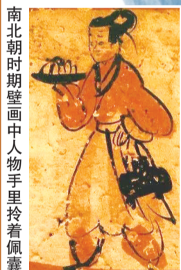
南北朝时期壁画中人物手里拎着佩囊