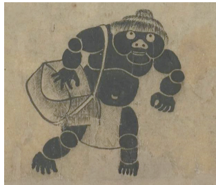
龚开《中山出游图》中的招文袋