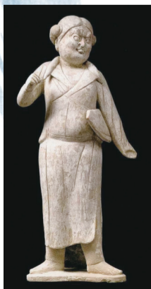
唐朝胡人背包俑(西安博物院藏)

作为唐代的女性，怎么会放弃“包”治百病的“机会”？虽说唐代最有名的包是鱼袋，但从目前出土的笔画石刻以及陶俑来看，唐代女性对包那是相当有想法。如敦煌第十七窟北壁西侧面壁画晚唐近事女挂在树杈上的挎包，通体无任何装饰，只在搭扣处加以点缀，“外缝线”的款式看着就非常时尚；又如西安博物院藏的唐朝胡人背包俑，挎包的外形或方形，或扇形，无论是款式还是裁剪，丝毫不逊于现代人的国际大牌包。