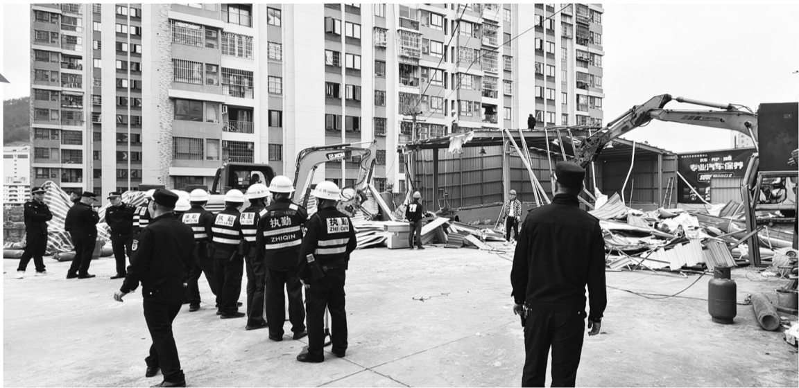
执法人员开展“两违”整治行动

此举将进一步明确细化“两违”工作中乡镇的分工和责任,确保“铁三角”工作机制有效运转,并确保畅通群众信访举报途径,发挥群众监督作用,改变“清理违法建设不力,监管工作不到位”的工作局面。