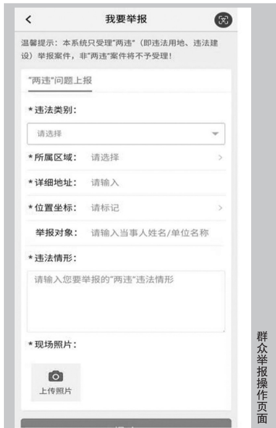
群众举报操作页面

同时,在“清新永泰”APP数字化监管平台上增加国土空间规划一张图功能,群众建房直接在手机APP上就可以核对本村的村庄规划,查看建房选址位置是否符合规划要求,避免建设时占用到管控红线而产生违建问题。