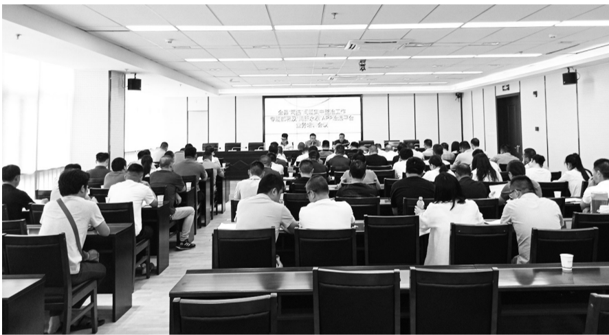
永泰县举行“清新永泰”“两违”综合治理监管平台启动仪式

上述工作人员坦言,传统的“两违”综合治理工作一直面临着信息不畅、处理不及时、群众参与度不高等问题。此次引入数字化技术,打造一款专门用于“两违”综合治理的移动应用有望破解这些难题。