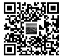
扫码下载“清新永泰”APP