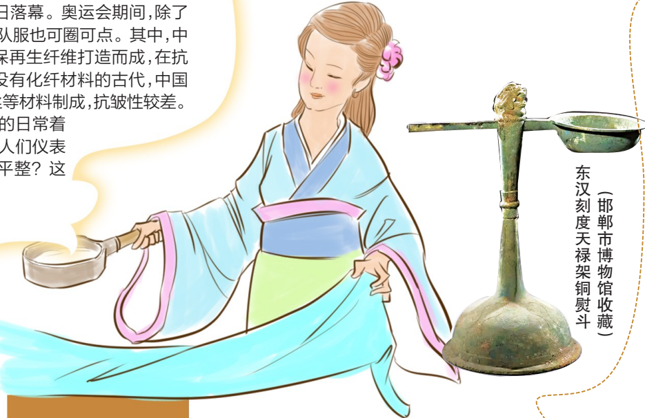
东汉刻度天禄架铜熨斗 (邯郸市博物馆收藏)