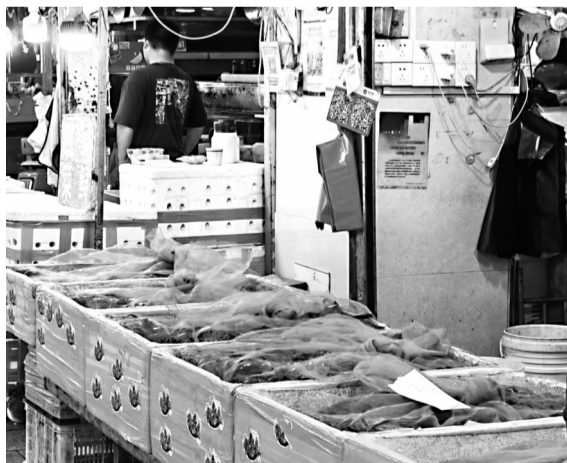
水产批发市场的大闸蟹来自江苏高淳

昨日,记者先是搜索了几款线上市民常用的买菜小程序。其中在朴朴超市的小程序上,在售的有来自不同地域的大闸蟹,其中有的标注产地为江苏省扬州市高邮市,还有的标注产地为新疆阿勒泰地区阿勒泰市。而在永辉生活小程序,大部分大闸蟹标注着产地为江苏,单只价格在4.8元至28.8元不等,也有不少大闸蟹并未明确标注产地。