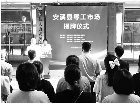
安溪县零工市场揭牌仪式现场

工市场、泉州芯谷安溪分园区零工市场等一批零工市场已集中揭牌启用,为灵活就业者提供更多就业机会,进一步满足求职者即时快招、灵活就业和企业用工需求,为安溪就业市场带来全新活力。