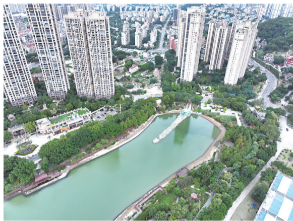
琴亭湖湖体内正在进行便道建设

自2016年之后,时隔8年,福州琴亭湖湖体迎来第二次清淤。昨日,记者从福州城投集团所属市城乡建总获悉,琴亭湖湖体清淤及泵站提升和周边井店湖、涧田湖清淤工程已于近期启动,将力争在明年汛期前全部完工,预计总清淤将超29万立方米,相当于再挖2.3个涧田湖。