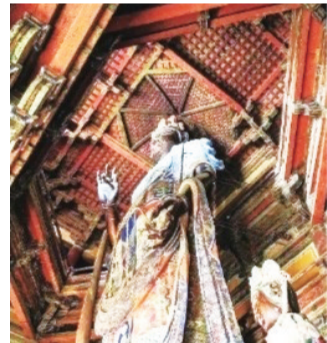
现存最早的木构藻井

藻井的工艺非常复杂,工匠们不用钉子,利用榫卯、斗拱堆叠而成,被认为是中华木造建筑一项繁杂的装饰技术。现存最早的木构藻井是天津市蓟州区独乐寺观音阁上的藻井,为方形抹四角,上加斗八(八根角梁组成的八棱锥顶)。