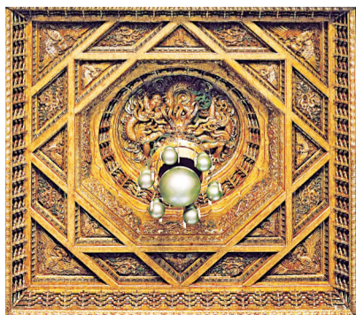
故宫太和殿内的蟠龙藻井