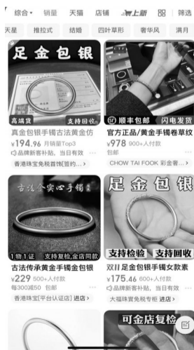
金包银饰品在电商平台销售走俏

随后,记者找到了位于台江区瀛洲街道上的一家专门售卖“金包银”饰品的非品牌店铺。一进店门,各种“金包银”的手链、手镯、项链等饰品摆放在展柜内,与纯金饰品的外观并无区别。据店主介绍,目前“金