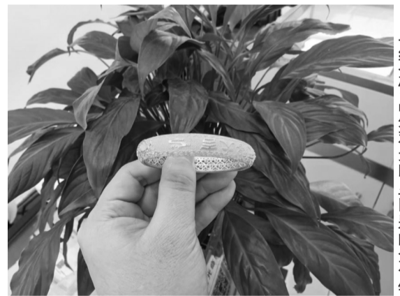
与纯金饰品外观无明显区别的“金包银”

“‘金包银’饰品和纯金饰品一样是可以回收的,回收价格根据当日金银价格而定。”上述店主表示,这为其增加了不少市场竞争力。