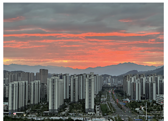
福州天边如绚丽的调色盘

海都讯(记者 吴诗榕文) 朝霞不出门,晚霞行千里。昨晚,夕阳西下时,福州的天边绽放出绚丽的调色盘。云层厚重却层次分明,橙色与灰色交织在一起,形成温暖又神秘的色彩效果。阳光透过云层,照亮这座城市,金光洒在楼宇之间,仿佛披上一层薄纱。今明两天,福建多云