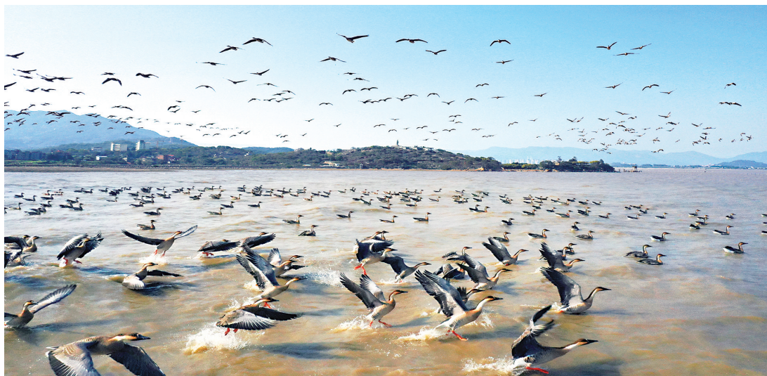
《浪里飞歌》

10月下旬,第一批冬候鸟陆续到达闽江河口湿地,11月底至12月初将迎越冬候鸟迁徙的高峰期