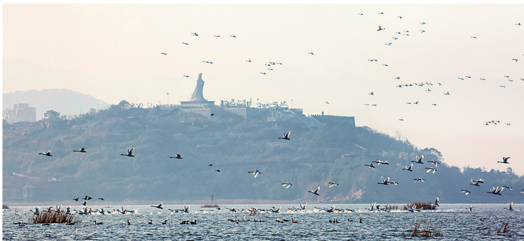
《湿地飞羽》

“来闽江口观鸟,最好选择每天的最高潮位前后一小时,到观鸟屋和堤坝上观赏水鸟。大家可以通过查潮汐的软件进行查询,同时一定要带上望远镜,最好是单筒望远镜。另外冬季海边风大,要注意防寒保暖。”闽江河口湿地工作人员建议。