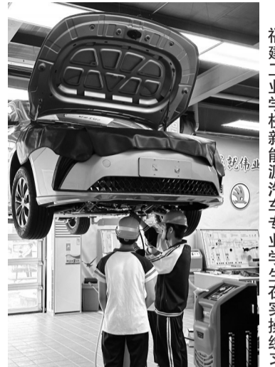
福建工业学校新能源汽车专业学生在实操练习