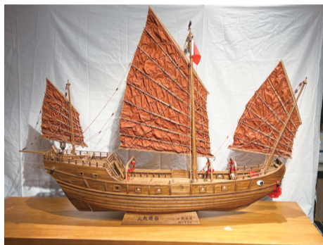
船政学院制作的赶缙船结构复原模型

同时,500强企业宁德时代首次参展,与福船集团携手共同牵头电动船舶展区,为展会注入了新的活力与期待。