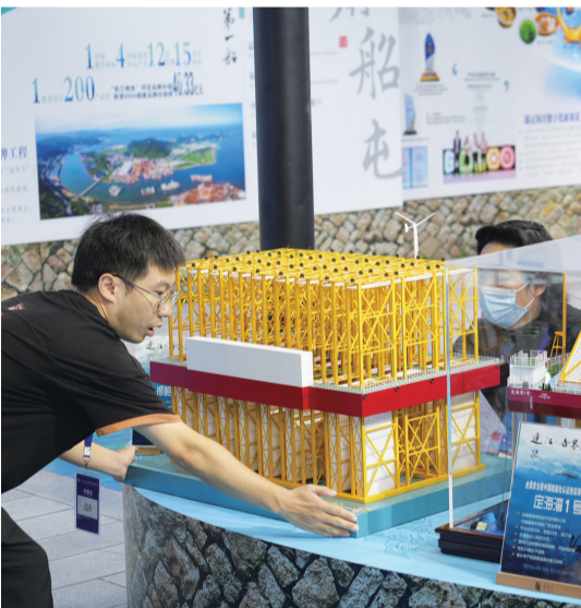
连江展区展示的现代海水养殖设备