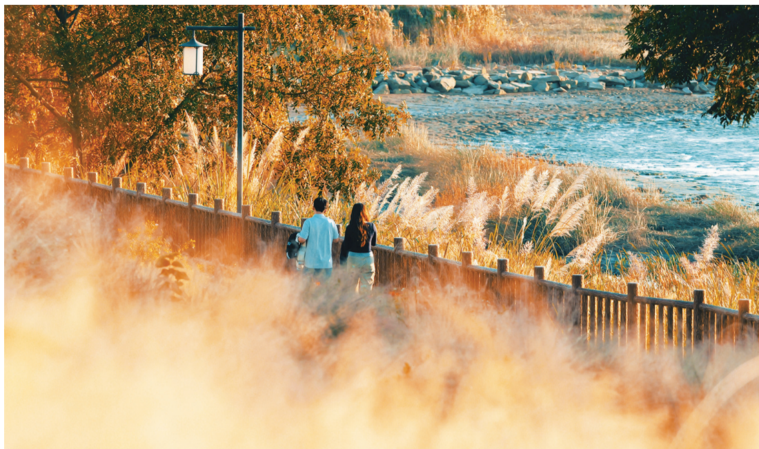
市民在乌龙江边散步,夕阳为粉黛乱子草罩上一层金黄色