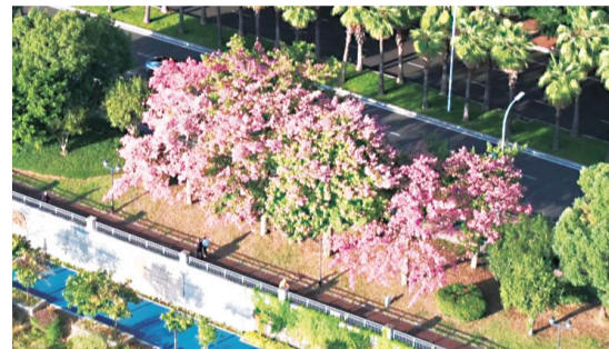
绽放的美丽异木棉让人仿佛穿越到了春天