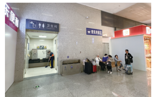
就是便民用餐区 卫生间外约五米处

海都讯(记者 梁展豪 文/图) 近日,有市民向海都热线968880报料称,福州火车南站二楼候车厅内的一处便民用餐区设置在卫生间旁边,这样的布局不太合理。