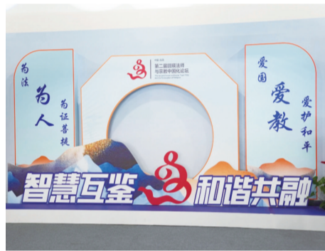
论坛延续“智慧互鉴 和谐共融”主题