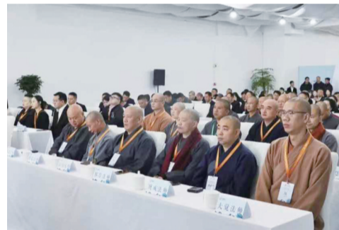
来自海内外的高僧大德、专家学者齐聚一堂展开文化交流