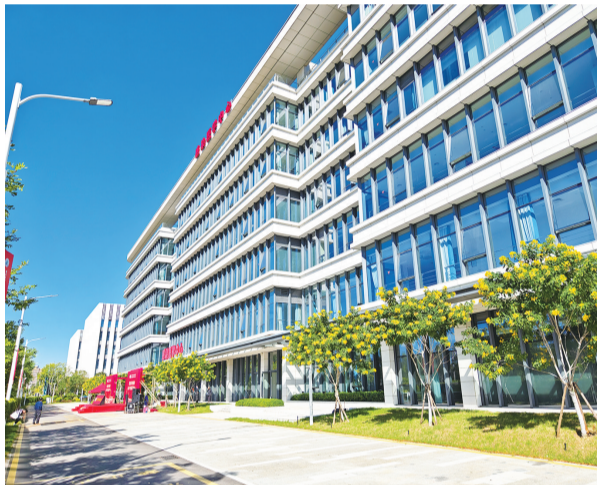
华山医院福建医院感染医学中心大楼

中心有独立的感染病大楼,含门诊单元。核定床位200张、14张感染ICU床位,内设感染性疾病科、