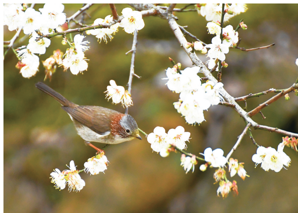
青梅盛开似雪(资料图)

海都讯(记者 吴诗榕/文) 未来十天,福建以多云到晴天气为主,受多股冷空气影响,最低气温持续较低,最强冷空气影响时段为28—30日。