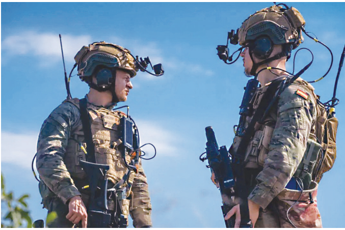
佩戴“未来士兵系统”增强现实设备的人员

2024年,世界多地硝烟弥漫,传统火力战虽仍是“主角”,但智能化特征已然显现。战场从传统空间向新兴领域拓展,武器装备远程化、智能化、隐身化、无人化趋势明显,战争形态正在加速演变。高端战争的竞争,离不开军事技术的竞争。2024年岁末,让我们一起盘点那些隐藏在战火硝烟背后的军事技术的无