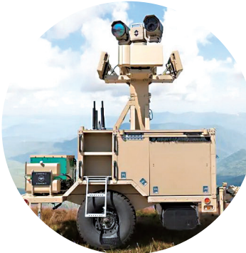
乐X反无人机系统 美国菲力尔公司的赛伯乐