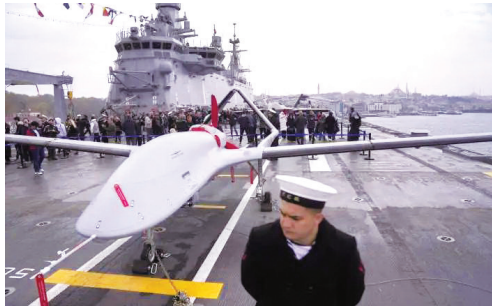
土耳其TB-3无人机在两栖攻击舰上成功起降