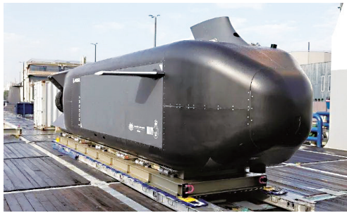
澳大利亚“幽灵鲨”无人潜航器原型机