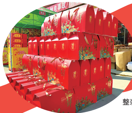
商品礼盒 整装待发

搭配了一款“三荤三素”礼盒,包括羊肚菌、竹荪、姬松茸、九节虾、目鱼干、鱼胶,“这样一份礼盒大约400元上下,礼盒中的分量、数量以及品类均可根据需求自选,价格上也是丰俭由人。”