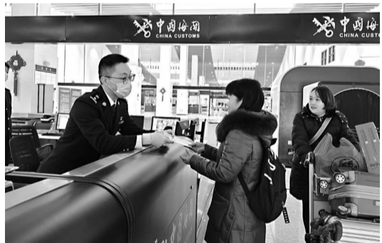
马尾海关旅检关员为进境旅客详细介绍海关行李监管规定

海都讯(记者 林涓 通讯员 司超) 一衣带水的两岸,1小时20分钟的航程,23海里的距离。随着2025年春运到来,“马尾—马祖”航线迎来两岸同胞返乡、探亲、旅游的热潮。1月26日,载着130名旅客的“安麒6号”班轮从马祖抵达福州马尾琅岐对台客运码头。“新年快乐!欢迎来到福州。”在马尾琅岐通关现场,欢迎语、红灯笼、中国结、“福”字等新年装饰随处可见,LED屏滚动着欢庆语,让马祖乡亲感受浓浓的节日氛围和家乡年味。