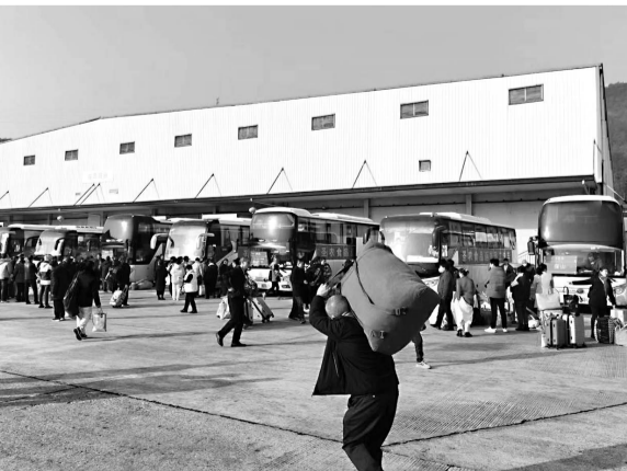
务工人员乘坐“点对点”包车回家

目前,福州市台江旅游汽车有限公司、福建光大旅游汽车有限公司、福州鑫凯旅游汽车有限公司、福建云旅旅游服务有限公司等多家客运企业已