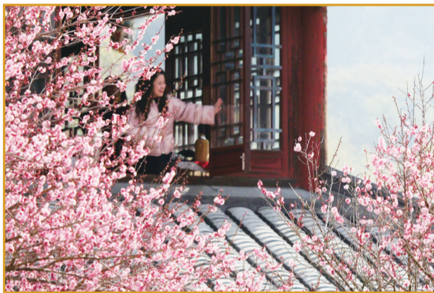
推窗见梅，美得如梦如幻

除了儿童公园之外，福州的赏梅胜地还有很多，位于市中心的福州西湖公园就是其中之一。赏梅点分布在开化屿梅园、梦山十三梅亭等处，品种有官粉梅、白梅、青梅等。赏梅作为西湖公园一年花事的序章，与迎春的元宵灯会和早春的桃花共同构成一幅独属于西湖的美丽画卷。