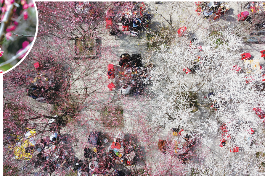
林阳禅寺内，游客在梅花下喝茶赏花，甚是惬意