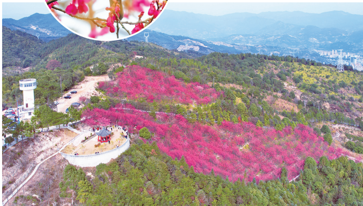
闽清钟石山漫山遍野的山樱花，美如云霞

记者了解到，钟石山山樱花最佳赏花期在2月中旬前，天气即将转好，走，一起赏花踏春去！