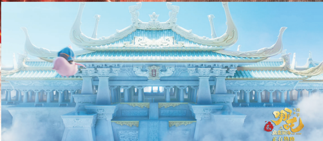
影片中的「玉虚宫」(电影海报)