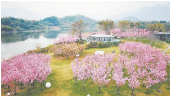
福州闽侯国宾樱花园美景