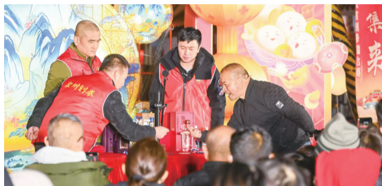
市民游客打擂台闹元宵

世遗泉州,浓烈年味非一般的感受。2月10日起,泉州状元古街一场持续3天的划拳擂台赛,吸引了一拨又一拨的人群围观、挑战,市民和游客共同体验了一把千年民俗的掌上竞技之乐趣。