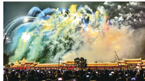
「七彩祥云」

海都讯(记者 吴日锦 通讯员 游雯星)“风调雨顺、国泰民安、万事如意……”2月11日晚,泉州惠安县东湖公园上空,璀璨的烟花绽放出一排排祝福语,吸引众多市民、游客观赏、拍摄。当晚惠安县举办大型新春烟花秀,在元宵节前夜制造了一场特别的空中浪漫。