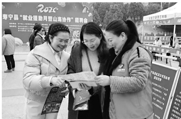
宁德市寿宁县举办“就业援助月暨山海协作”招聘会

海都讯(记者 何丹莹 福建省妇联供图) 近期,福建省妇联联合省人社厅等7家单位启动2025年春风行动,更好地服务稳就业、保用工、促发展。全省各级妇联组织写好“联”字文章,通过就业招聘、直播带岗、就业指导等方式,分行业、分领域、分群体开展各式各样的招聘活动,“真金白银”给支持、“线上线下”给岗位、“留人留心”给温暖,全力保障一季度“开工稳”。