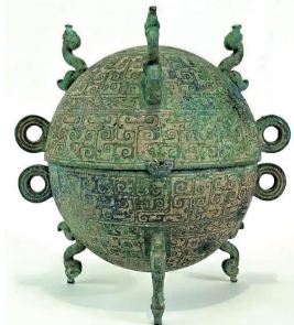
青铜“大西瓜”,它叫敦,但不念dūn