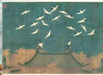
宋徽宗的“朋友圈”配图《瑞鹤图》

敖光一出场便吸粉无数,但他的大刀也同样吸睛,此刀名为“龙牙刀”。它的设计融合了两种不同的武器元素,前半部分参考了商朝时期的青铜刀,刀尖上挑、刀背附齿、刀腹略收,正是商朝青铜刀的典型特征,而后半部分则采用龙吞口,这种造型在关刀上最为常见,并从唐代盛行直至明代。