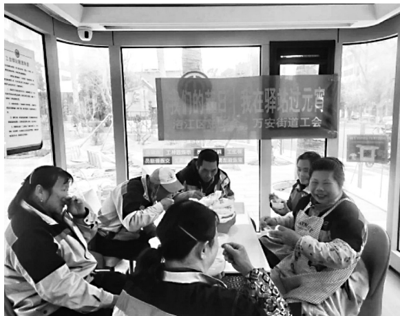
户外工作者在驿站里休息

均建立健全日常和安全管理等规章制度,并统一张贴规范服务公约,注明服务内容、服务对象、开放时间、管理人员姓名、联系方式等内容。驿站内还设有留言簿、心愿墙,户外劳动者们可以