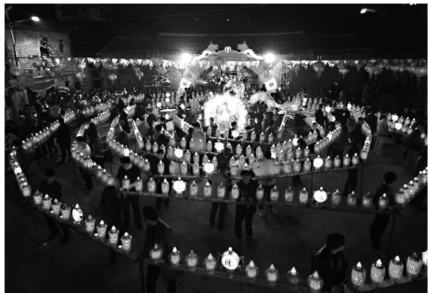
村民将灯架首尾相接,“灯龙”栩栩如生

游迴龙灯既是鸪林村村民对美好生活的期许,同时也照耀着他乡奋斗的村民们回家的路。“这是为全村人民祈福的活动,我每年都会回来参加,已经连续参加30多年了,只有游迴龙灯结束后,对我们来说才算过完年。”在福州工作的村民陈先生分享道。