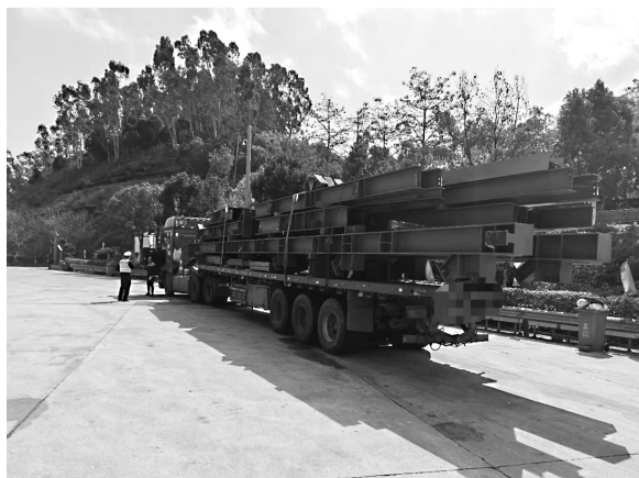
货物长度严重超出车身

据悉,泉州高速交警支队根据辖区道路交通实际,重点做好服务区货车停放秩序管控。同时,结合货车违法行为特点和运行时间规律,科学调整勤务部署,采取错时与延时相结合的方式,在加强货车通行频率较高路段流动巡逻密度的同时,在重点路口、路段设立固定检查点,对危化品运输车、重型半挂牵引车、中