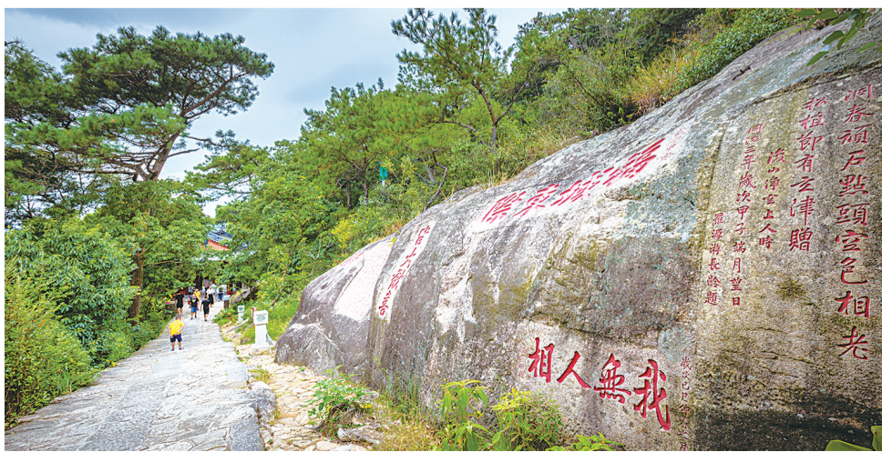
鼓山古道边的摩崖题刻

以“啪啪圈”形式呈现的地图手环,展示鼓山游览线路;圆鼓造型的小音箱,上面眷印的是位于灵源洞的摩崖题刻“山水知音”,适合健身爱好者;创意便签纸的设计可谓精妙,以插画的形式展示了灵源洞丰富的摩崖题刻,六面全彩印刷……这些文创产品不仅让游客将鼓山的文化带回家,更成为连接历史与现代的桥梁,让古老的摩崖题刻在新时代焕发出新的活力。