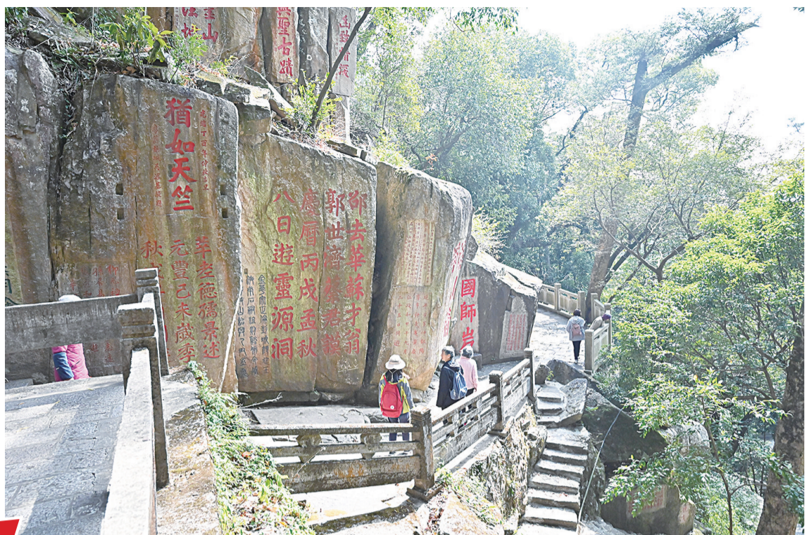
游客参观摩崖石刻