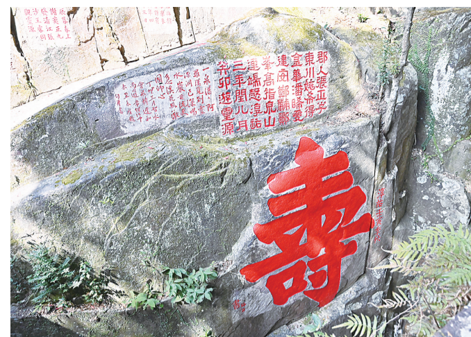
朱熹所书“寿”字是鼓山单字最大的摩崖石刻