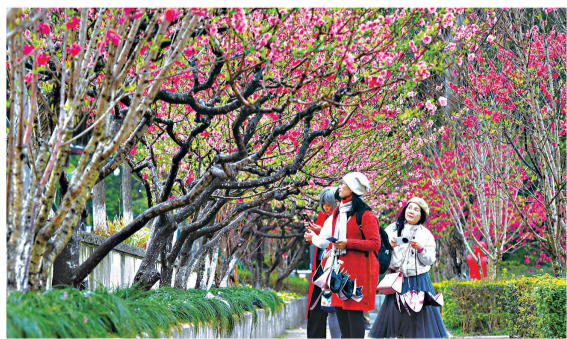
游客在雨中欣赏桃花

据福州西湖公园管理处相关人士介绍,西湖公园计划引入一些新品种桃花,待明年桃花盛开时,市民将会有更加丰富的观赏体验。