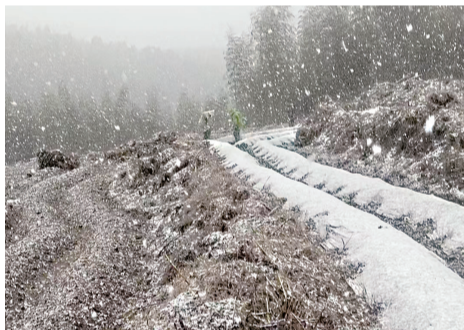
7日下午1时许,宁德市屏南县岭下乡路面覆上一层雪