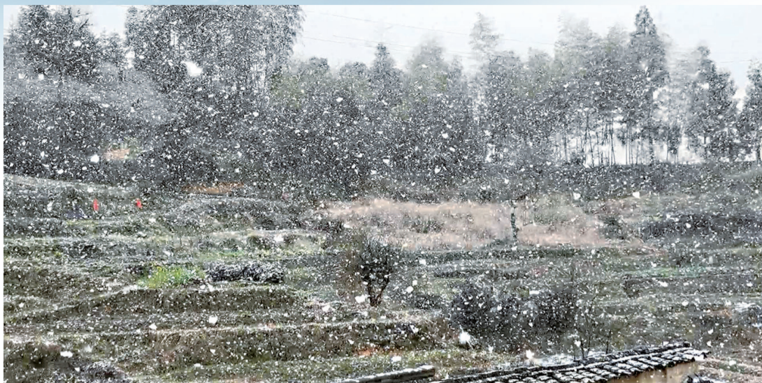
桃源自然村下起大雪

尽管冷空气常常来访,但向暖已是大势所趋。预计下周开始,随着暖湿气流再度增强,南方地区气温将迎来明显回升,并转为较常年同期偏暖状态。以福州为例,本周末气温将明显上升,下周一至周三最高气温将快速攀升至接近30℃,仿佛一夜入夏。但春季气温变化无常,升得高,降得也猛。预计12日之后,受冷空气影响,福州气温将出现大幅下降,一天之内从29℃降至19℃,市民需注意及时增减衣物,谨防感冒。