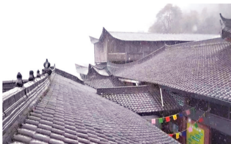
7日下午1时许,南平市建阳区庵山下雪了