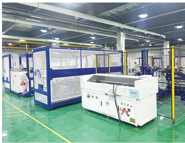
利莱森玛机电园已投产的恒温洁净车间

入春时节,福州市仓山区项目建设如火如荼,拼抢赶超春潮涌动,处处跳动着高质量发展的强劲脉搏,彰显出仓山区深化拓展“强产业 优环境”专项行动的坚定决心与坚实脚步,为全区经济发展注入新动能。