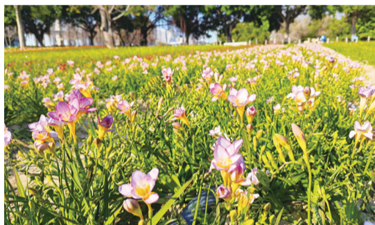
花形奇特,香气浓郁