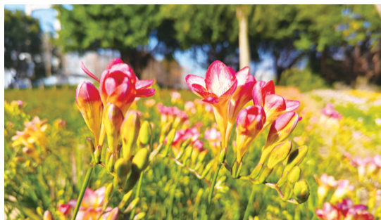
花期将持续至4月份左右

上述相关负责人表示,小苍兰的品种名为粉霞、紫依、春阳、红阳、香玉、紫冰、红月、紫芸等,“新品种颜色丰富多彩,有粉黄、淡紫、淡黄、正红、淡粉、玫红、粉紫等多个颜色,花期约1个月,将持续至4月份左右”。