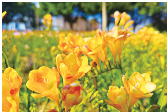
小苍兰花色丰富多彩