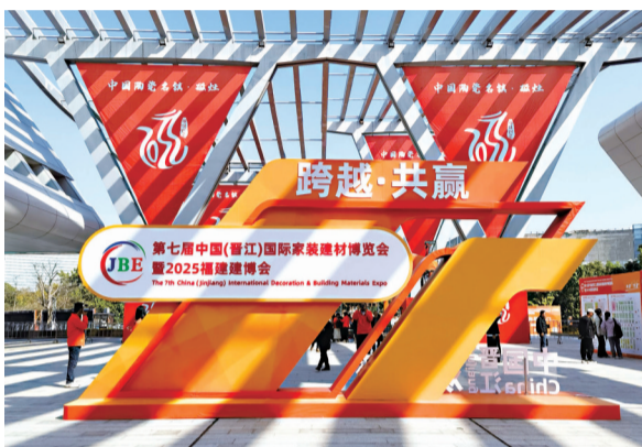
2025福建建博会在晋江国际会展中心举行

本届展会联动六大建材专业市场,展览规模实现了十倍扩容,为建材行业高质量发展注入强劲动能