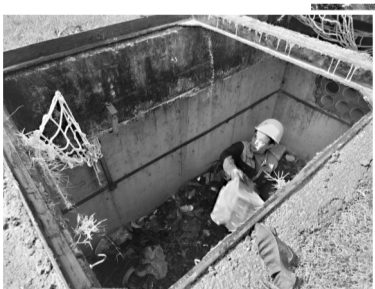
▲工人清理窨井内垃圾

海都讯(见习记者 王凯诺 文/图) 15日本报A06版《5公里路63个窨井“张嘴”》一文见报后，引发关注。昨日，记者从福州榕城港务发展有限公司(以下简称“榕城港务公司”)获悉，目前该路段沿线的窨井已全部加盖。记者在现场看到，垃圾清运工作正在全力进行。相关工作人员告诉记者，待整改工作全部完成后，窨井的管养工作将第一时间移交至相关部门。