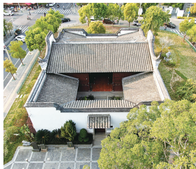
柔远驿为一进合院式硬山顶式建筑

局完整,建筑保存较好,但因修缮年代已久存在墙体脱落、开裂等问题。修缮设计单位经过前期勘测后发现,建筑承重结构中关键残损点或其组合已影响安全和正常使用,有必要采取加固或修理措施。为更好地保护历史文化遗产、延续古厝生命,柔远驿整体修缮工程日前已经启动。修缮工作将严格按照修缮设计方案及文物修缮“最小干预”原则,精心施工,确保“修旧如旧”,预计在今年10月,游客们就能再见的柔远驿的历史风华。