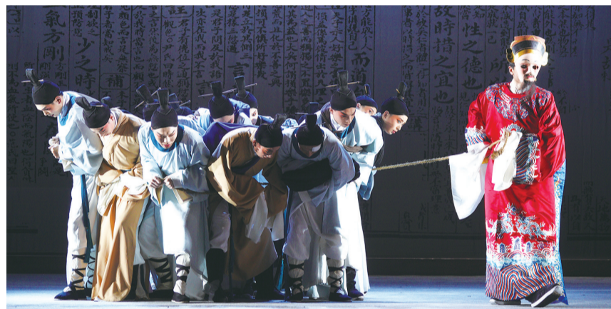
闽剧《画网巾先生》舞台照(资料图)