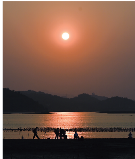
夕阳的余晖洒落江面,波光粼粼