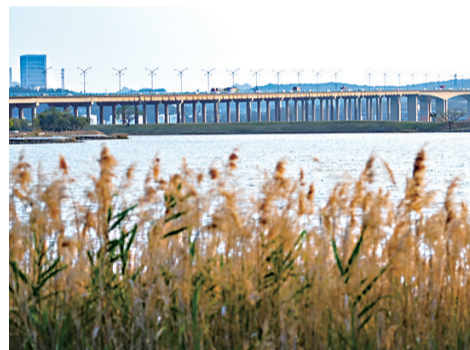
不远处的后渚大桥