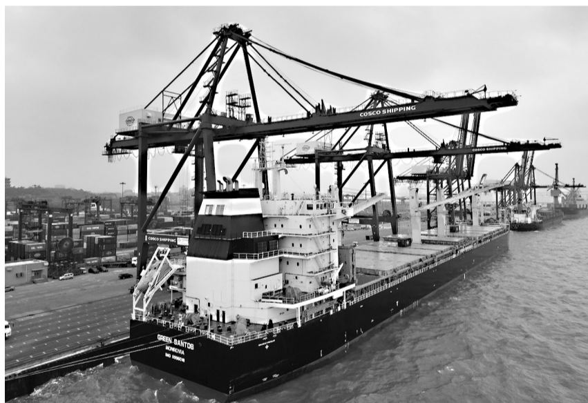
泉州—南美洲际“货运直航航线”开通

海都讯(记者 杨江参 通讯员 张桢炜 文/图)3月26日晚,利比亚籍货轮“桑托斯”号装载1.22万吨纸浆制品,安全靠泊泉州石湖太平洋集装箱码头,标志着“泉州—南美洲际”货运直航航线正式开通。