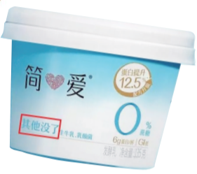
简爱酸奶,“其他没了”是商标