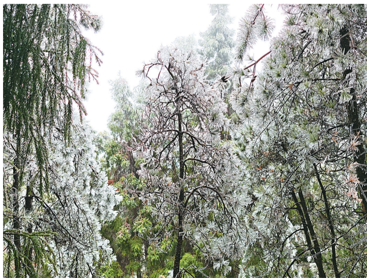
周宁仙风山雾凇景观

受此影响,福州的雨水天气也将持续到31日,不过,雨量总体不大。4月1日起,雨水逐渐停歇,天气转好。4月2日起,福州市区高温重回25℃,春游踏青又能继续安排上啦。