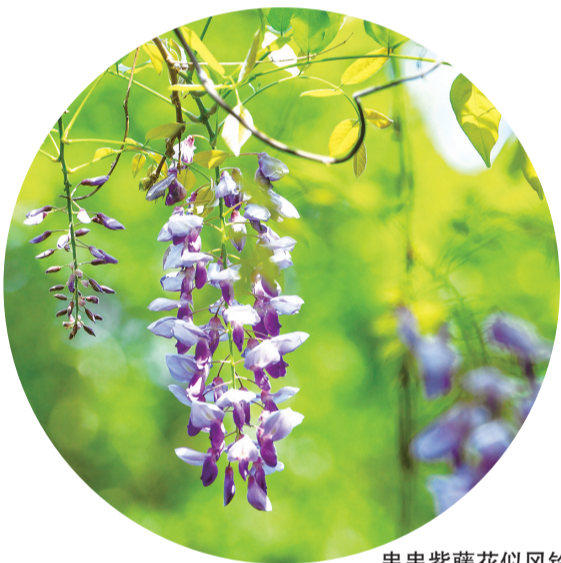
串串紫藤花似风铃垂挂

海都讯(记者 罗丹凌毛朝青文/图) 清明假期,难得的暖阳让福州花事尽染春光。走在白马河畔,仿佛踏入了一个紫色的童话世界。一串串紫藤花如紫色的风铃般垂挂在枝头,微风拂过,花朵轻轻摇曳,散发出阵阵淡雅的清香,引得蜜蜂、蝴蝶在花间穿梭忙碌。这些紫藤花历经近30年的生长,枝干粗壮,藤蔓蜿蜒,有的攀附在长廊的支架上,有的则垂落在河畔,与清澈的河水相互交融,构成了一幅绝美的自然景观。