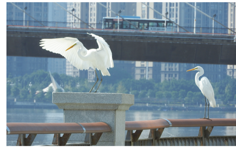
闽江畔苍霞公园,白鹭振翅欲飞