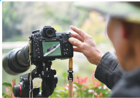
鸟儿灵动的身影,吸引不少拍鸟爱好者