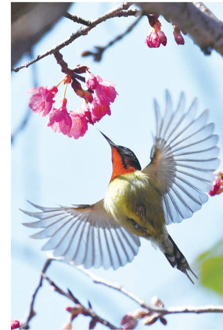
叉尾太阳鸟凌空悬停吸食花蜜