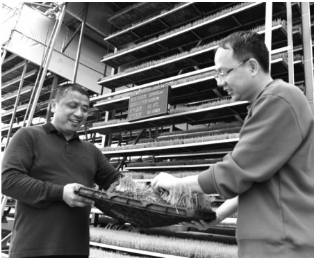
新设备可通过电脑监控秧苗成长