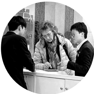
虽临近下班,但建行工作人员仍然热情接待焦急的外籍教师

支持。 最终,在警银双方的紧密配合下,成功抓获涉诈嫌疑人2名,同时警方根据线索顺藤摸瓜,成功挽救了1名正遭受电信诈骗的受害人,成功拦截被骗资金20万元,避免了群众的财产损失。 事后,南安市公安局对建行南安支行严谨的工作态度、高效的协作能力以及强烈的社会责任感给予了高度评价,并希望警银双方进一步深化合作交流,不断探索创新协作方式,共同为维护金融秩序稳定、保护人民群众财产安全作出积极努力。 建行南安支行有关负责人也真诚表示,该行今后将继续秉持社会责任,与公安机关紧密携手,持续加强信息共享与业务协同,为守护人民群众的“钱袋子”筑牢坚实防线,在反诈斗争中展现建行力量。