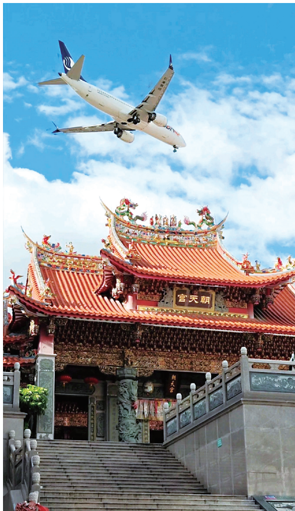
以飞檐彩脊为背景,可拍摄飞机从上方飞过全景

除此之外,园区亮点之一,46位国家级、省级、市级工艺美术大师及传承人的工作室入驻在此,犹如动态艺术磁场,可以看到木雕、金苍绣、花灯、竹藤编、木偶制作、福船制作等传统艺种域。在金苍绣非遗传承人工作室里,绣娘指尖翻飞的金线正编织刺桐花纹。