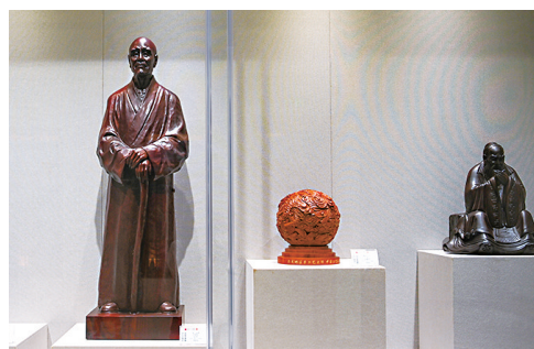
大师之作演绎匠心刻度